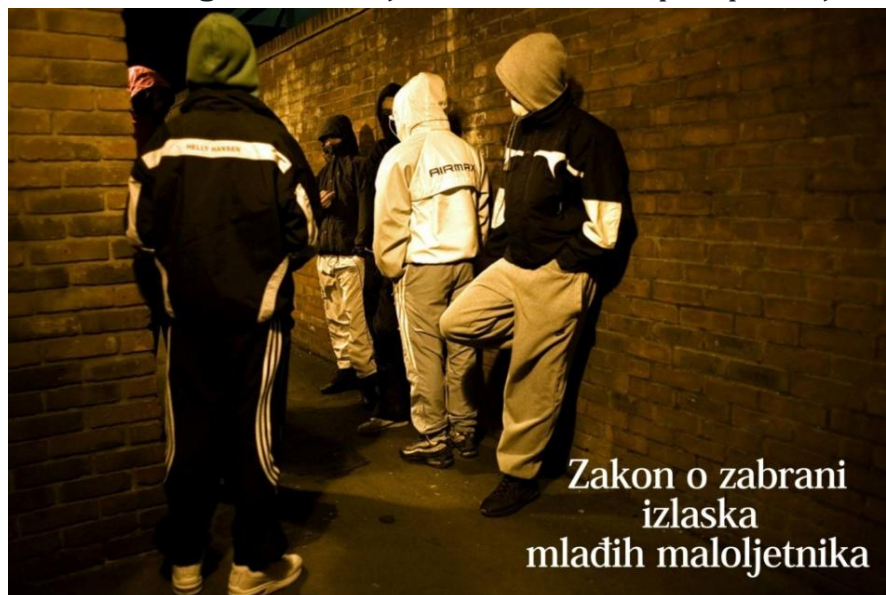
Zakon o zabrani izlaska mlađih maloljetnika

Čitav program bi se radio u saradnji sa "Socijalnom službom", koja bi uvela "treću smjenu" od najmanje jednog socijalnog radnika (veći gradovi i više) koji bi nadzirali grad u saradnji sa Policijom. Dokaz da socijalni radnik stvarno obilazi grad bio bi GPS uređaj u vozilu socijalnog radnika. Time bi se obezbjedila potpuna kontrola procesa primjene Zakona. Sredstva za primjenu ovog Zakona bi se obezbijedila iz budžeta Opština.